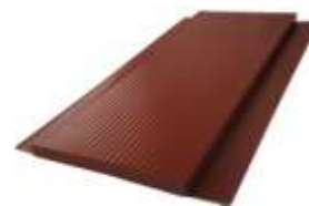
Внешний вид рифленой фасадной панели

Панели комплектуются доборными элементами: планками, кронштейнами и навесной системой