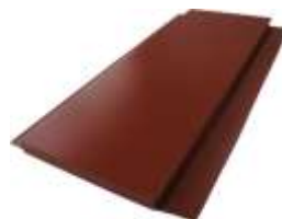
Внешний вид гладкой фасадной панели